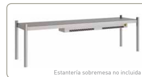
Estantería sobremesa no incluida