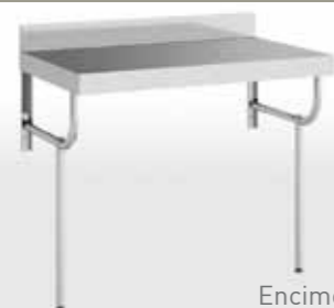
Encimera no incluida